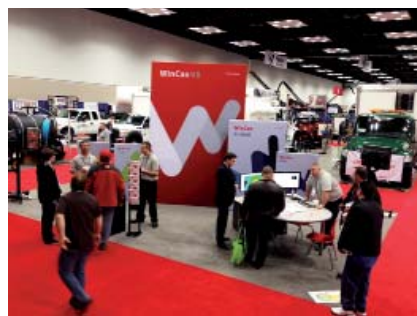
WinCan-Messestand auf der „Pumper-Show“ in Indianapolis, USA

Mit mehr als 1.500 Lizenzen ist WinCan auch in den USA der Marktführer, ebenso wie auch in Europa. Somit war klar, dass die neue Softwareplattform nicht „nur“ auf der IFAT, sondern auch auf der wohl weltweit zweitgrössten Messe unserer Branche, der „Pumper-Show 2014“, vorgestellt wurde. Der Messeauftritt erfolgte natürlich im neuen Produkt-Design und unterstrich damit die Bedeutung der Neukonzeption der füh-