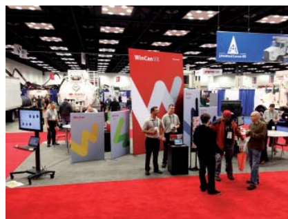
Umringt von grossen Spülwagen – dennoch gut sichtbar: der WinCan-Messestand in „Indy“

Die Messe war sehr gut besucht, insbesondere konnten durch den neuen Marken-Auftritt auch viele Neukunden gut angesprochen werden.